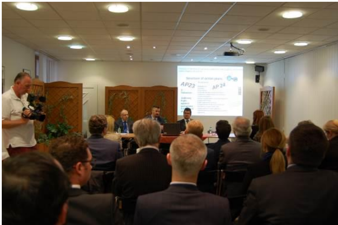
Montenegro on the Way to the European Union, Bratislava – 5. apríl 2016