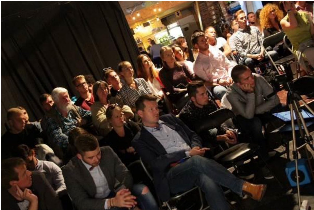
Café Európa: Bratislavský samit a budúcnosť EÚ, Banská Bystrica – 21. september 2016