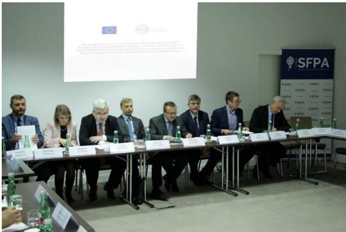
II. Slovensko-ukrajinské diskusné fórum, Bratislava, 25. október 2016