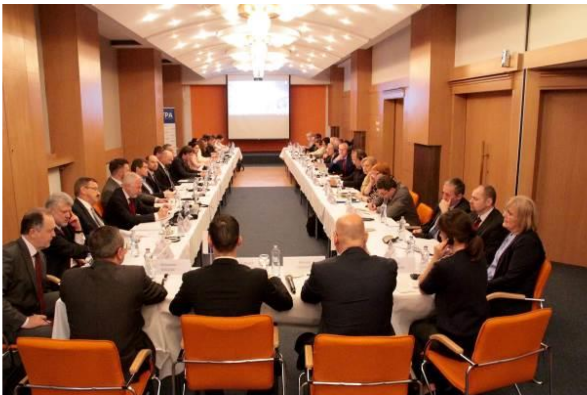
I. Slovensko-ruské diskusné fórum, Bratislava – 26. máj 2016