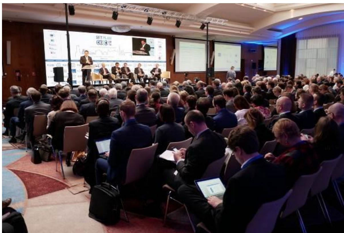
Konferencia: SET Plan 2016 - Central European Energy Conference X, Bratislava – 30. november – 2. december 2016