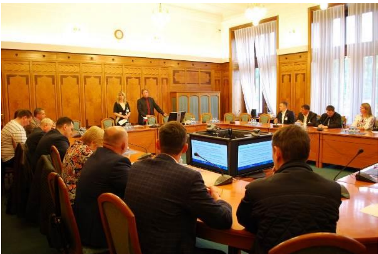
Training module for representatives of Ukrainian municipalities in the Czech Republic, Brno – 15. máj 2016