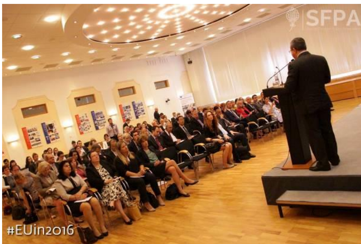
Konferencia: EÚ v roku 2016: ako odolávať odstredivým silám, Bratislava – 17. jún 2016