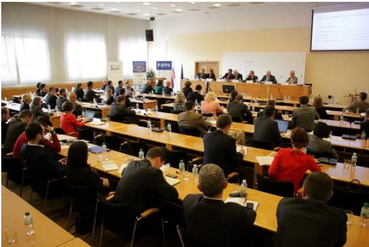
Konferencia EU Eastern Policy in the Light of Slovak Presidency in the EU Council, Bratislava – 24. október 2016