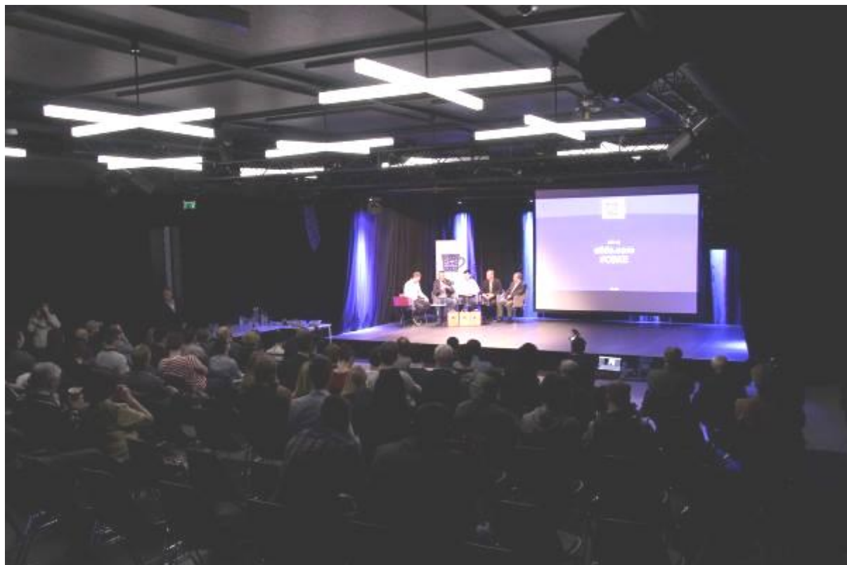
Café Európa: Aktuálna situácia na Ukrajine, Košice – 19. apríl 2016