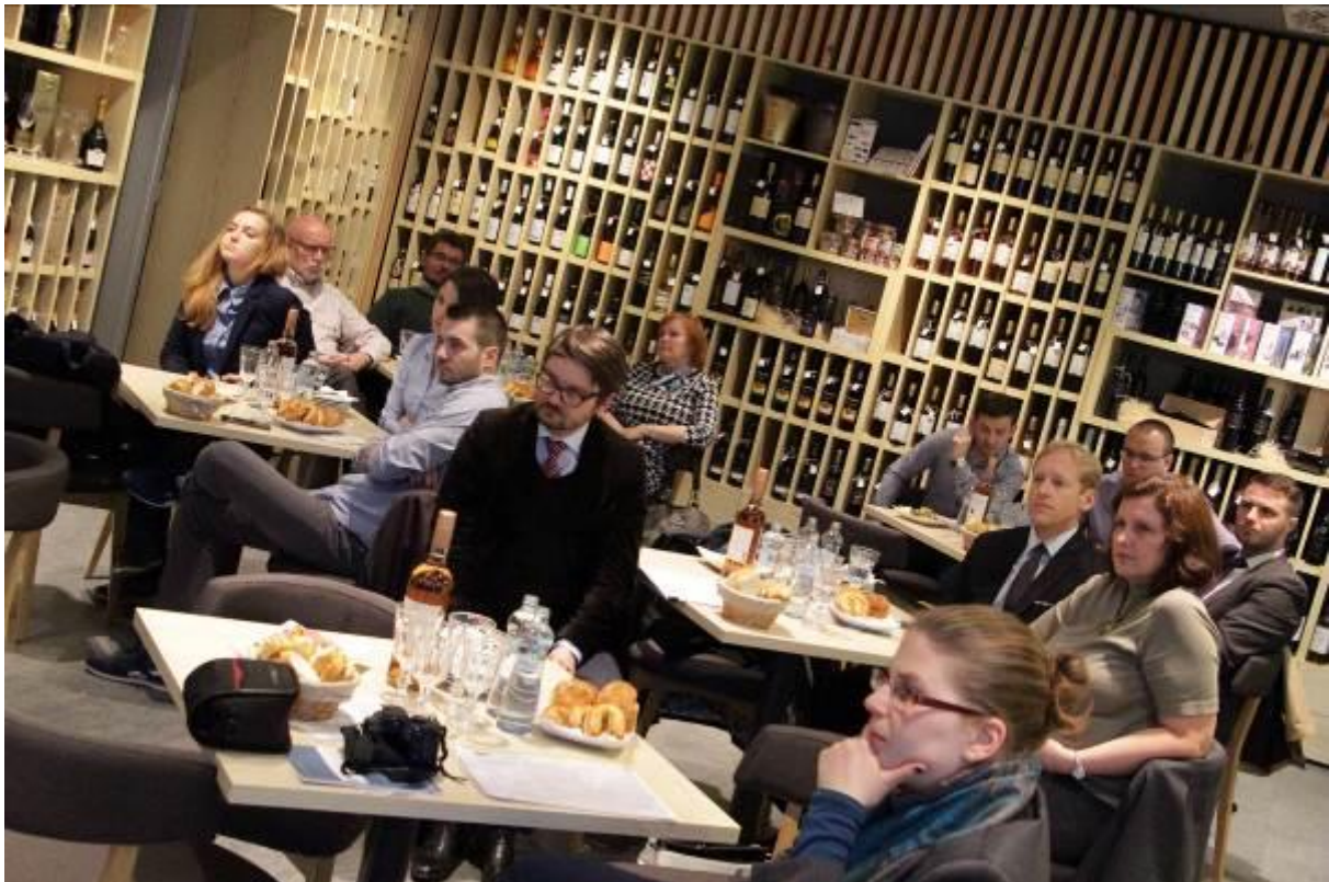
Prezentácia publikácie: Slovakia: (Re)Discovering of the international crisis management , Bratislava – 2. máj 2016