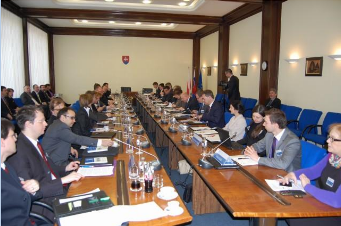
I.Slovensko-poľské diskusné forum; MZV SR, 10.2.2012