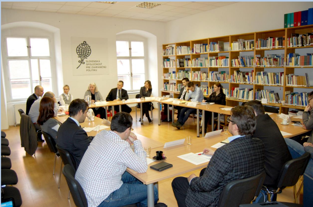
Sharing Experience from EU Presidency: Denmark and the Visegrad Countries; SFPA, 30.11.2012