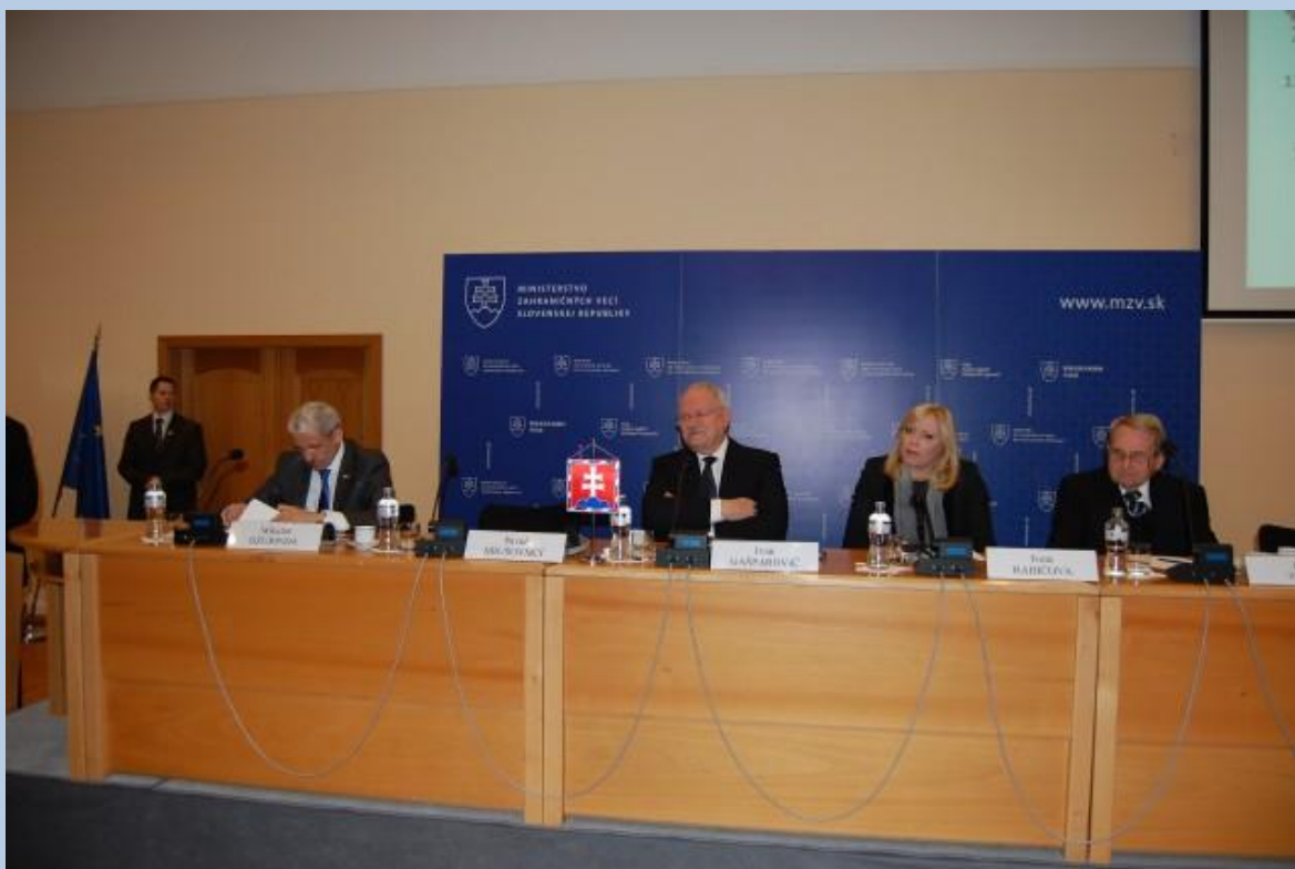
XIII. ročník Hodnotiacej konferencie zahraničnej politiky Slovenskej republiky za rok 2011; MZV SR, 14.2.2012