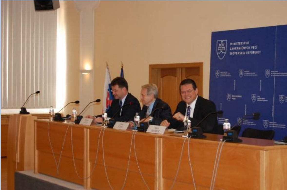
EÚ v roku 2012: fiškálna zmluva a budúcnosť integrácie; MZV SR, 31.5.2013