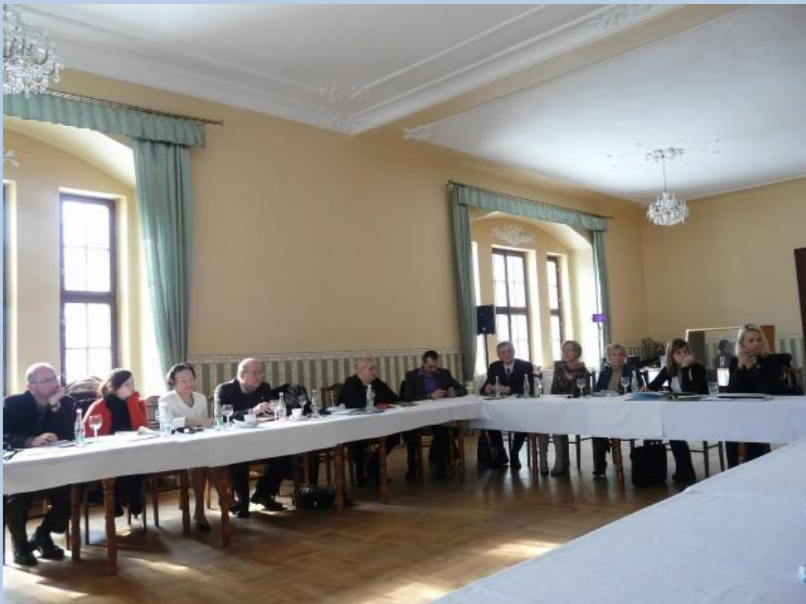
Hľadanie modelov tolerantnej spoločnosti v strednej a východnej Európe; Kaštieľ Fričovce, 15.2.2012