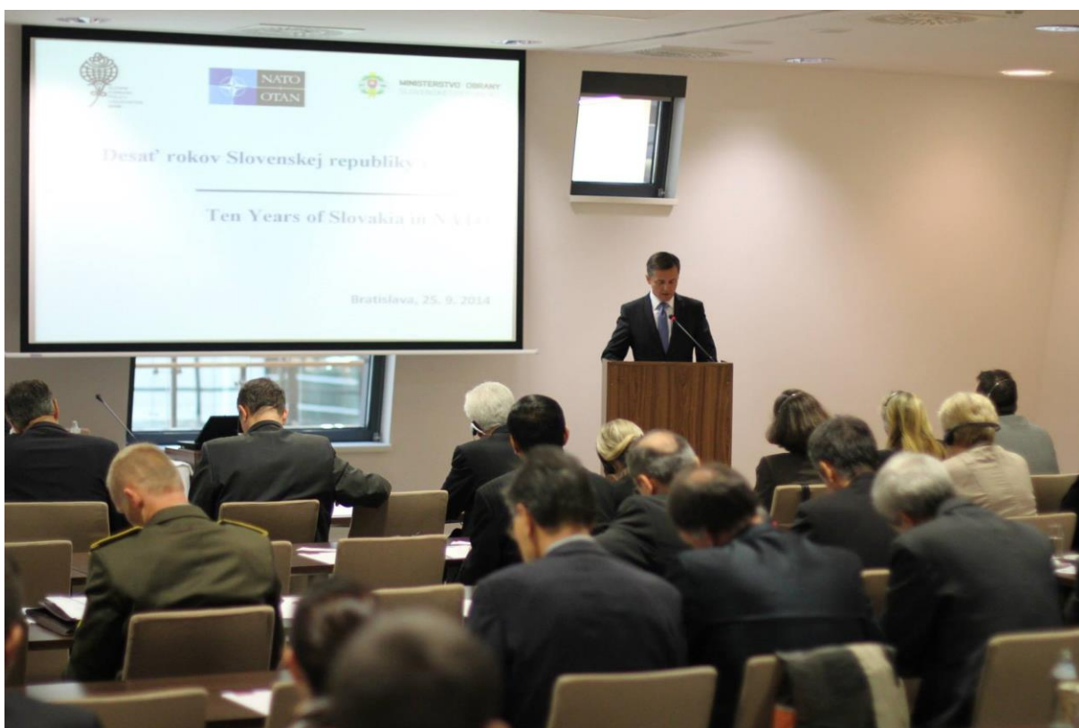
Konferencia: Desať rokov Slovenskej republiky v NATO, Bratislava – 25. september 2014