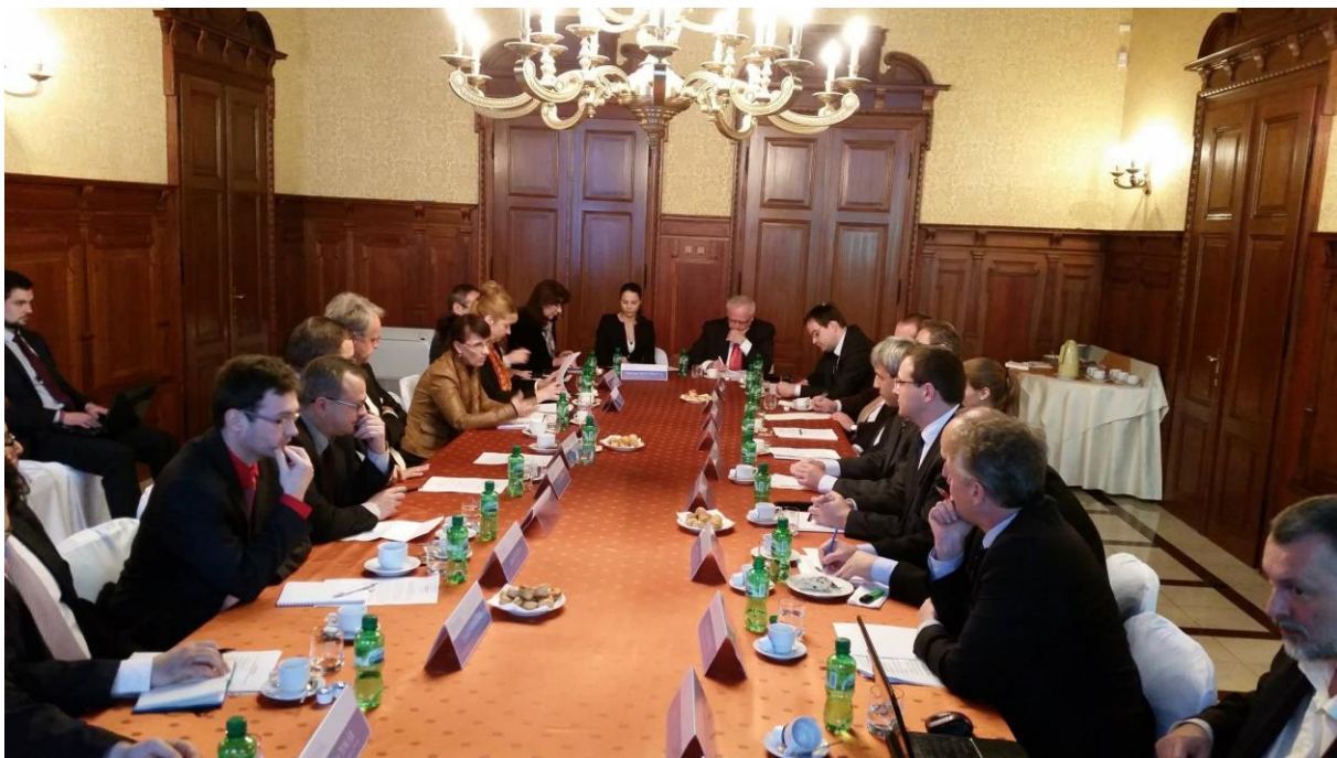
Rokovanie slovensko-maďarského fóra, Bratislava - 19. november 2014