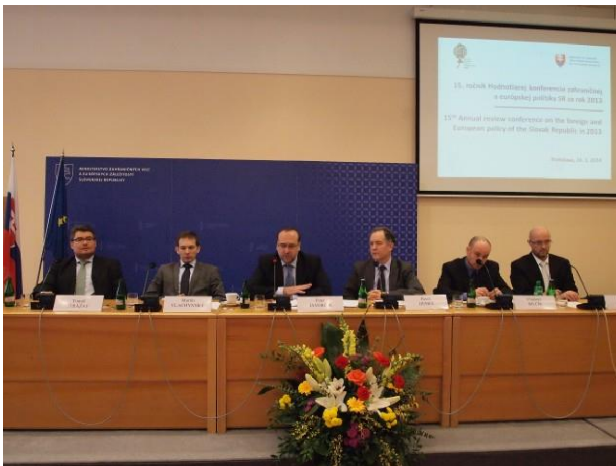
15. ročník Hodnotiacej konferencie zahraničnej politiky SR, Bratislava - 24. marec 2014