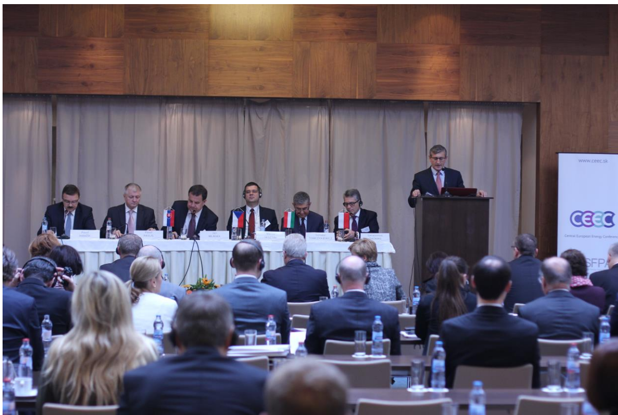
8. ročník medzinárodnej energetickej konferencie „Energetická politika EÚ a energetická bezpečnosť strednej Európy“, Bratislava – 23. – 25. november 2014