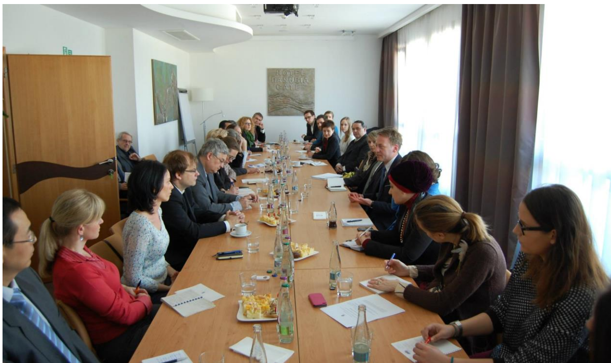
Kosovo Talks , Bratislava – 24. február 2014