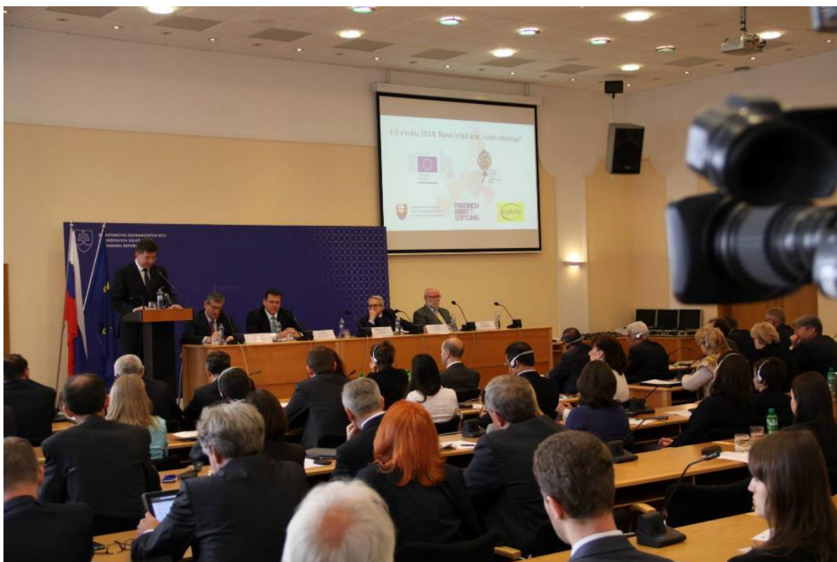
Konferencia: EÚ v roku 2014: Nové inštitúcie, nové reformy? , Bratislava – 9. jún 2014