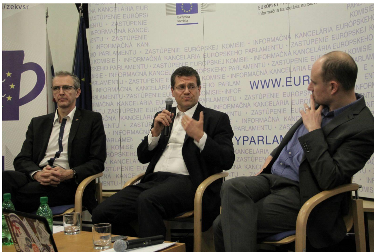
Diskusia: Café Európa – Na čo si trúfa nová EÚ? Bratislava, 11. december 2014