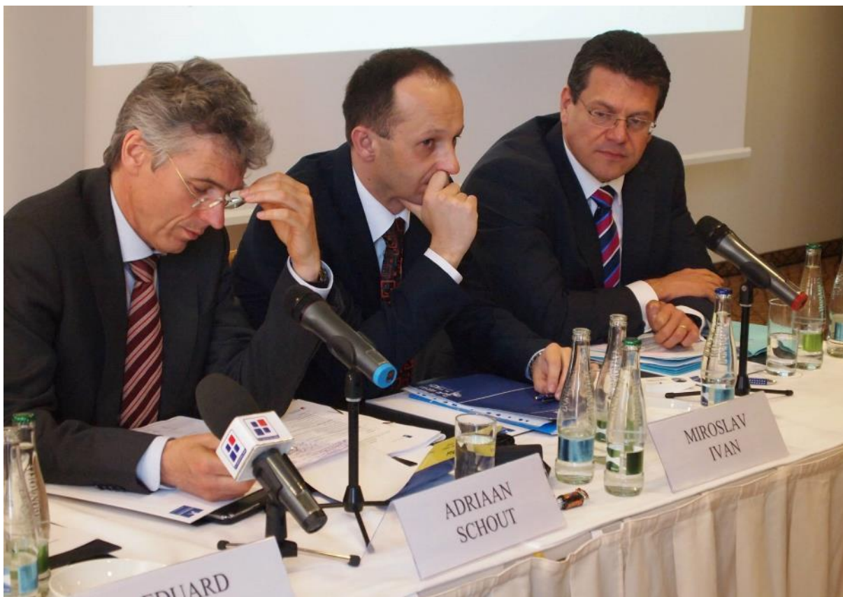
Konferencia: More Focus - More Voters? , Bratislava – 11. apríl 2014