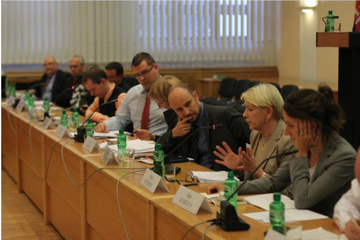
Konferencia: East European crisis: scenarios and EU response , Bratislava – 27. október 2014