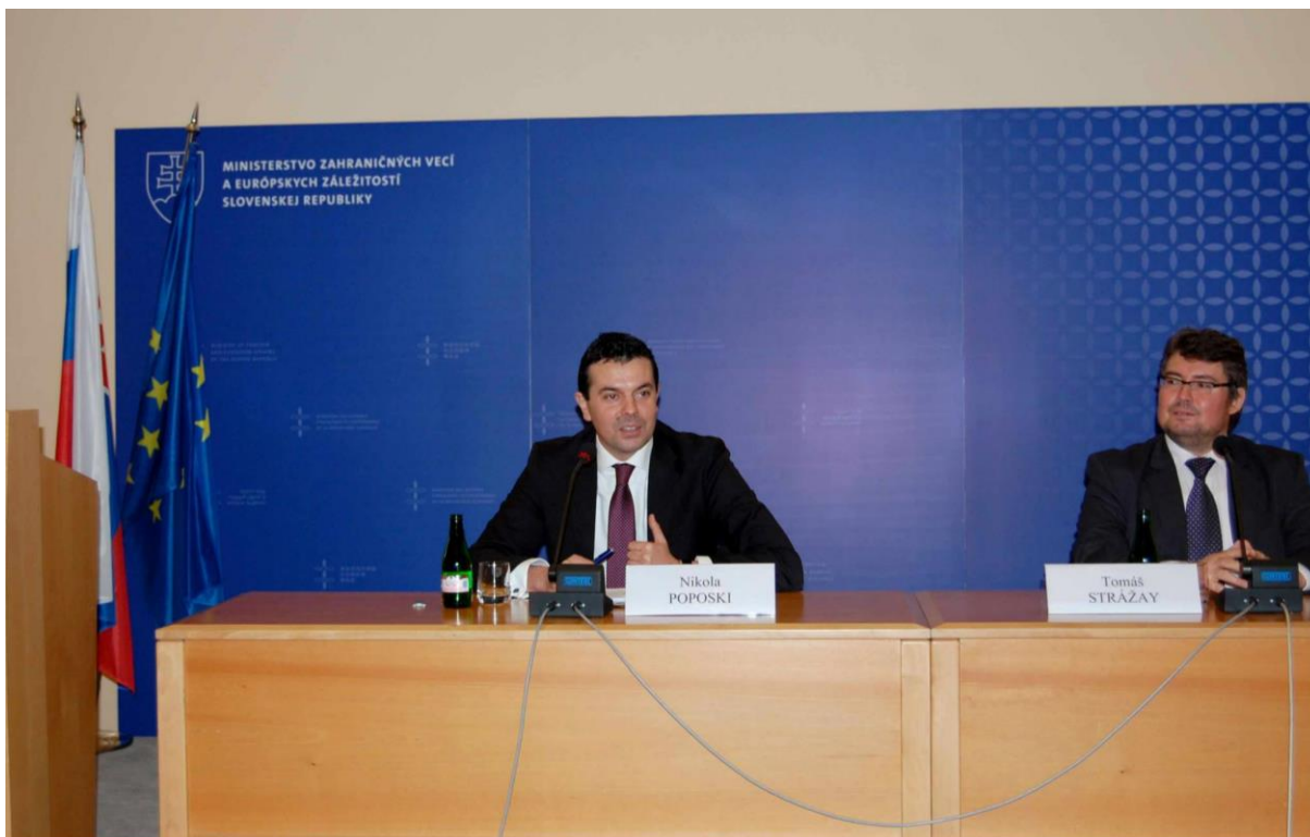
Konferencia: European Perspective of the Republic of Macedonia , Bratislava – 25. február 2014