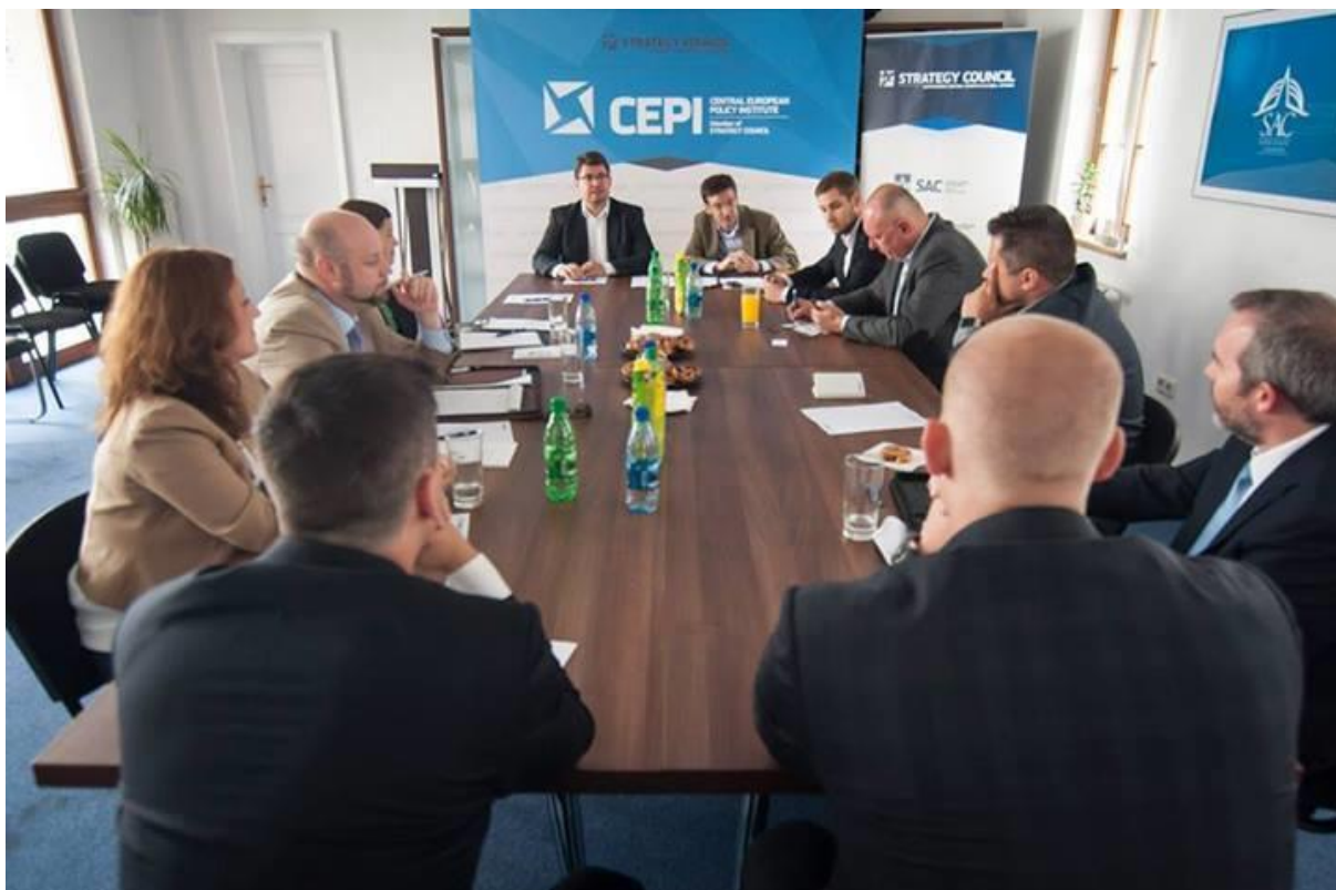
Think Visegrad U.S. Fellowship Program 2014, Bratislava – 8. – 10. júl 2014