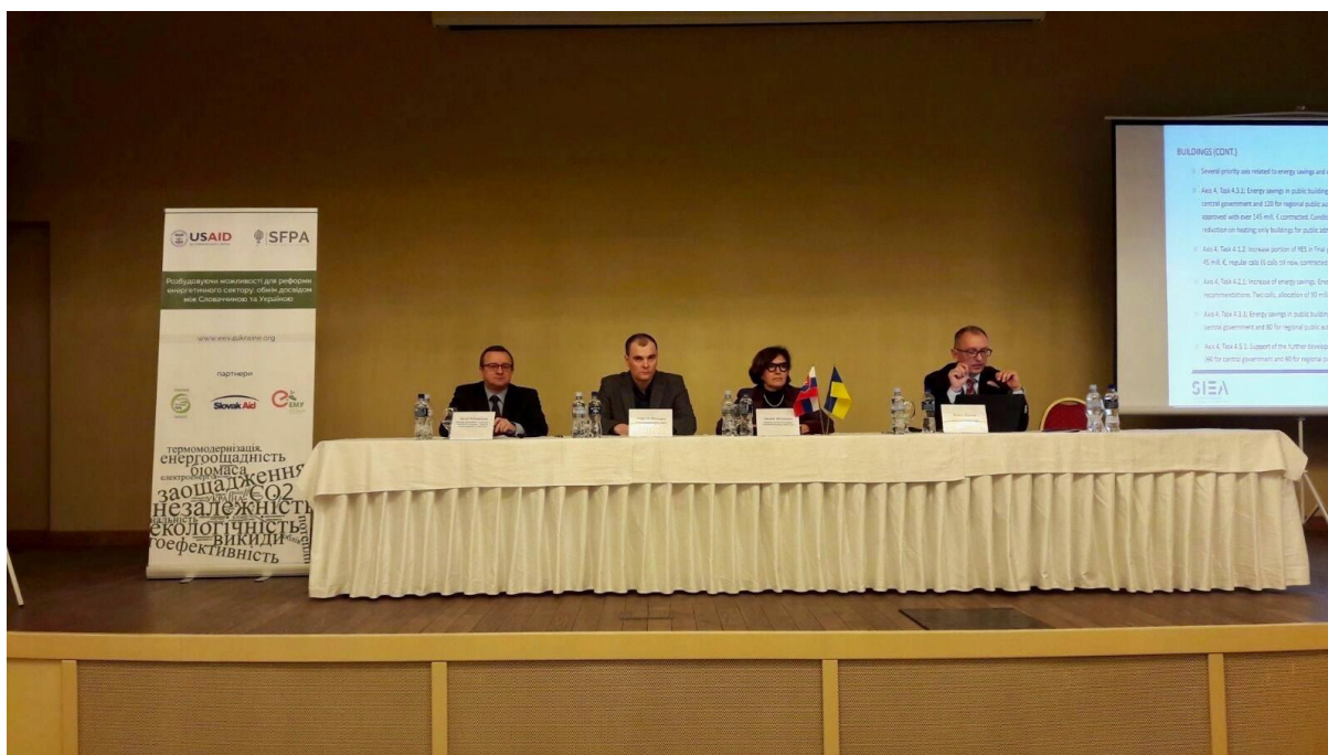
Promoting energy efficiency in Ukraine: the best practices from Slovakia, Dnipro – 27. február 2017