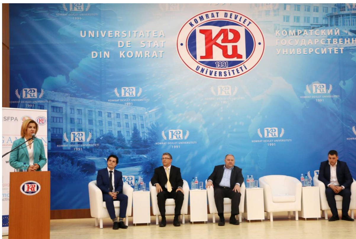
Plenary Session (Official opening of the project Gamcon), Komrat – 7. apríl 2017