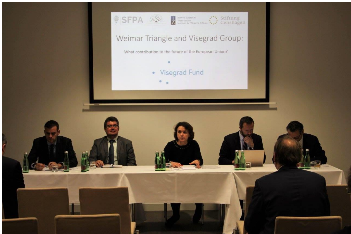
Weimar Triangle and Visegrad Group: What contribution to the future of the European Union?, Bratislava, 26. október 2017