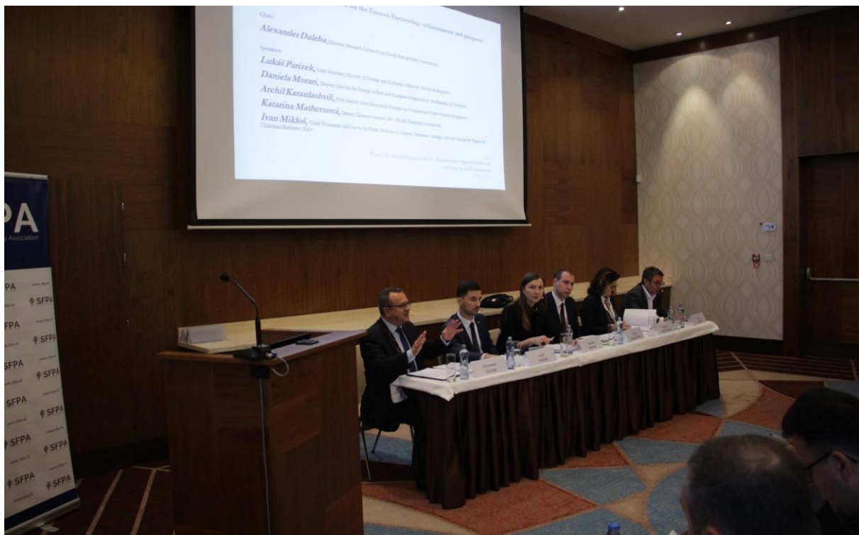
Konferencia Taking Stock of the Eastern Partnership: achievements, prospects and a role for the V4. Towards the Fifth Eastern Partnership Summit in Brussels , Bratislava – 23. október 2017