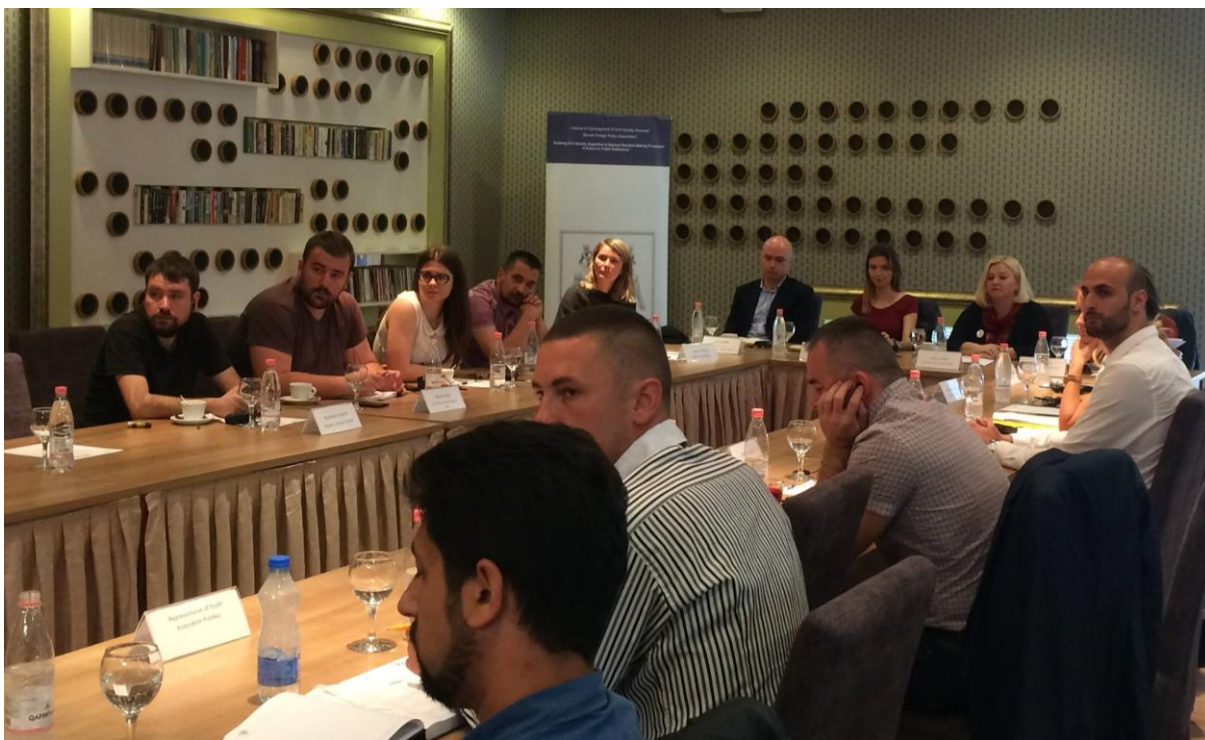
Civil Society Experience Sharing - "Building Civil Society Capacities to Improve Decision-Making Process in Kosovo's Public Institutions.", Kosovo – 13. april 2017