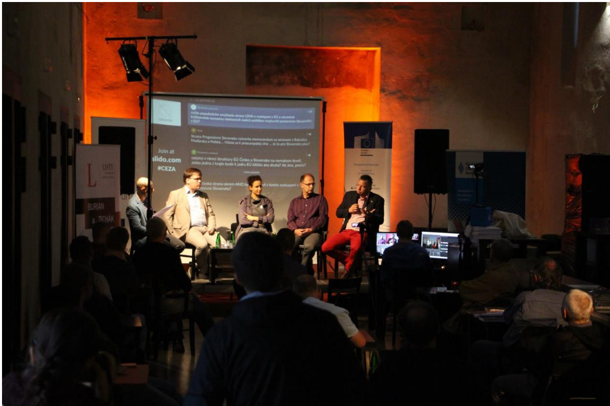
Diskusia Café Európa – Európska budúcnosť Česka a Slovenska, Žilina – 20. september 2017