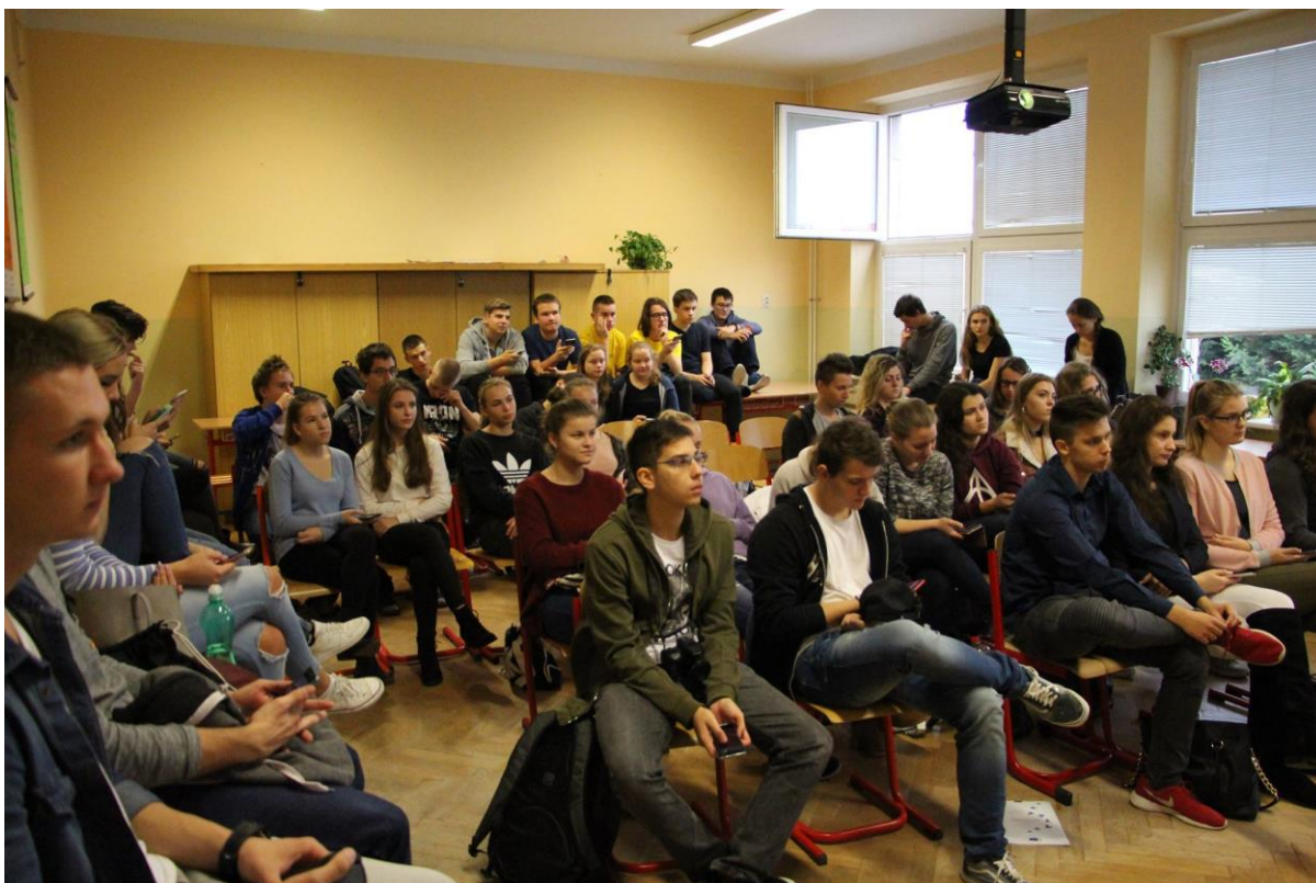
Prednáška v rámci projektu Európa v nás , Hlohovec – 8. november 2017