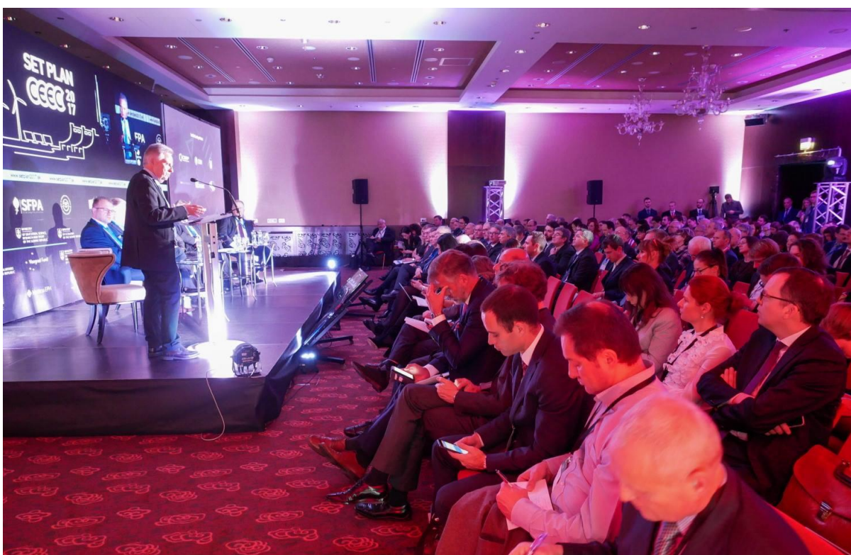
Konferencia SET Plan – Central European Energy Conference 2017 , Bratislava – 29. november – 1. december 2017