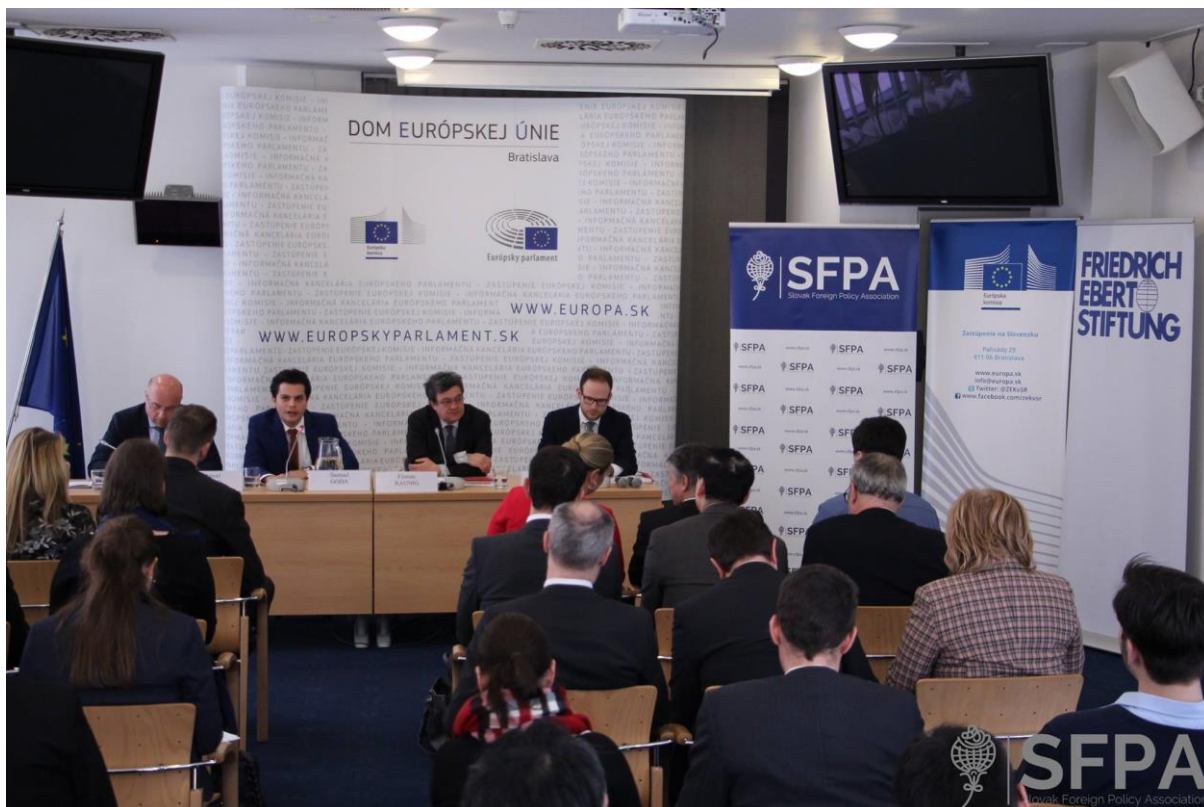
OSCE in light of (old) new challenges, Bratislava – 7. marec 2017