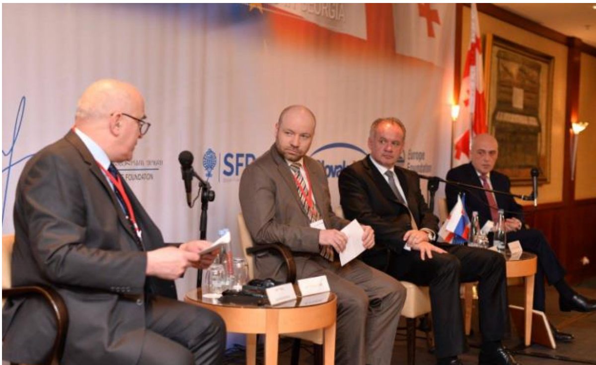
Plenary session of the project „National Convention on the EU in Georgia“, Tbilisi – 17. február 2017