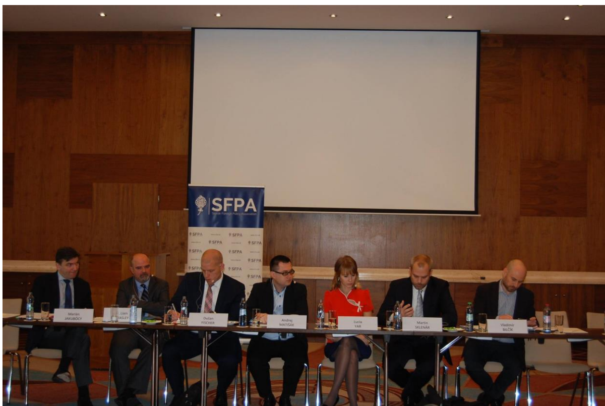
USA a EÚ: Rok po prezidentských voľbách, Bratislava – 8. november 2017