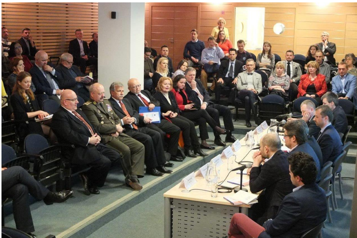
Prezentácia publikácie: „Súčasnú slovensko-poľské vzťahy“, Bratislava – 23. marec 2017