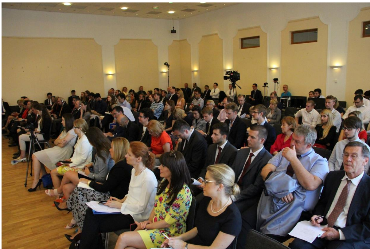
Konferencia EÚ v roku 2017: ako zaistiť lepšiu budúcnosť Európy?, Bratislava – 19. jún 2017