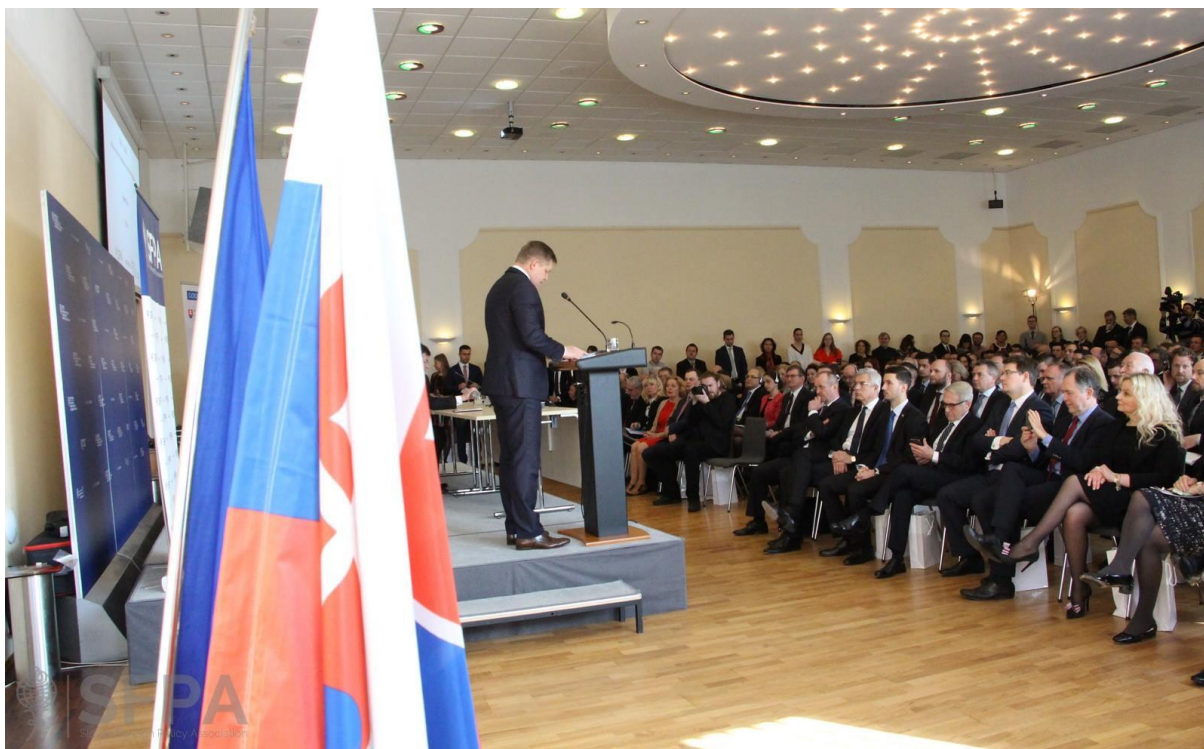
XVII. ročník Hodnotiacej konferencie zahraničnej a európskej politiky Slovenskej republiky za rok 2016, Bratislava – 16. marec 2017