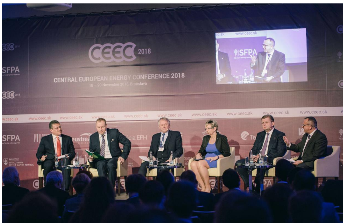
Central European Energy Conference 2018, Bratislava – 18 – 20. november 2018