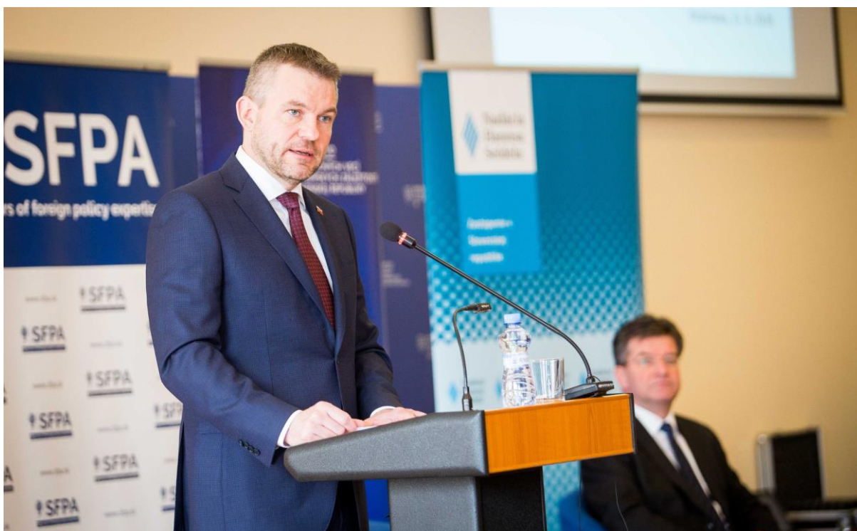
XVIII. ročník Hodnotiacej konferencie zahraničnej a európskej politiky Slovenskej republiky za rok 2017, Bratislava – 11. apríl 2018