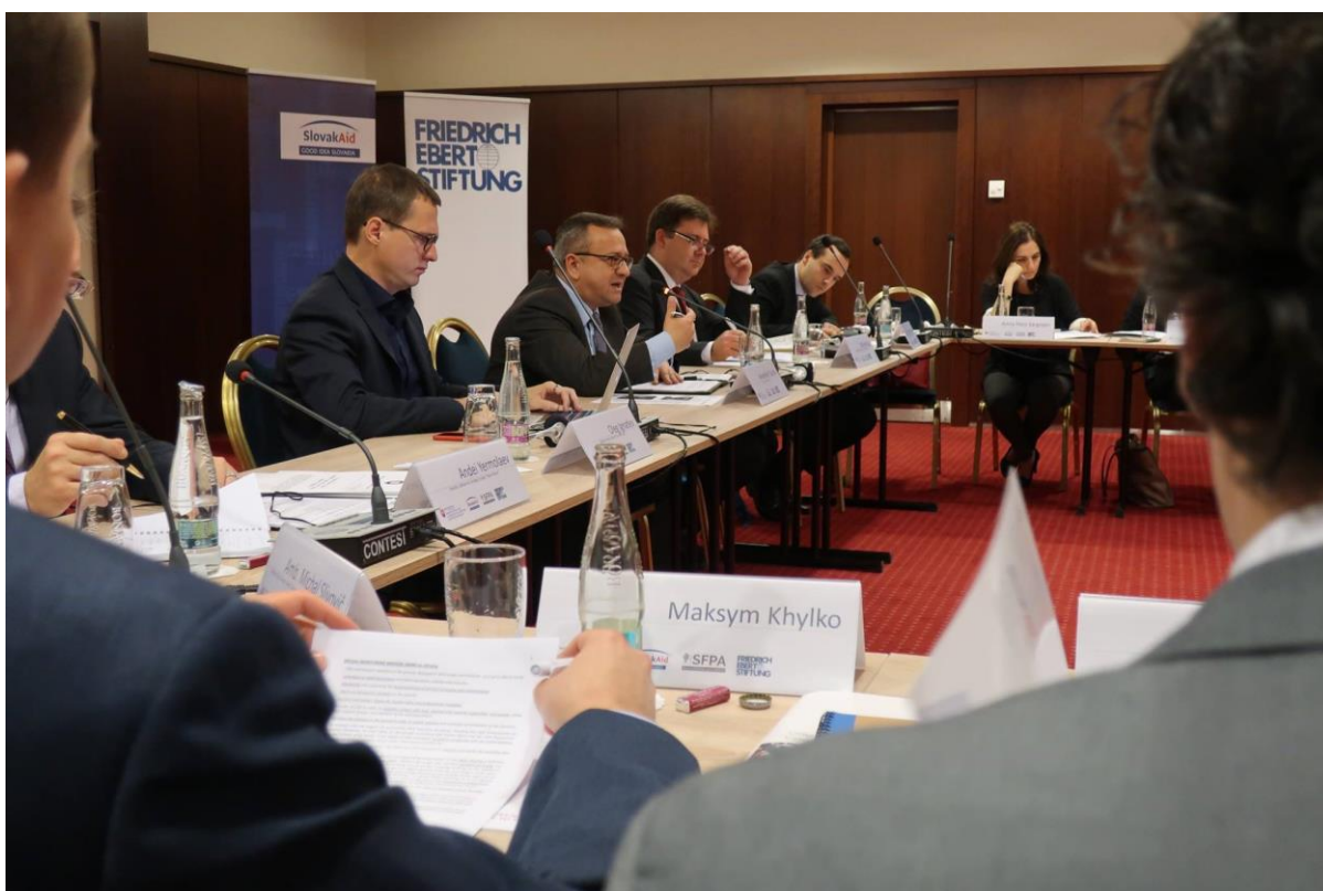
Role of the OSCE in managing the crisis in Eastern Ukraine, Bratislava – 23. november 2018