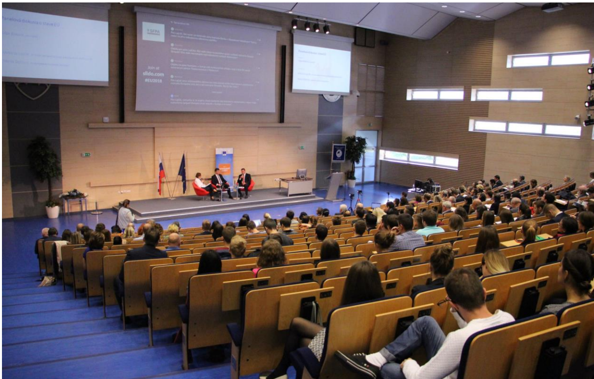
EÚ v roku 2018: môže byť Európa úspešná po voľbách do Európskeho parlamentu?, Bratislava – 11. október 2018