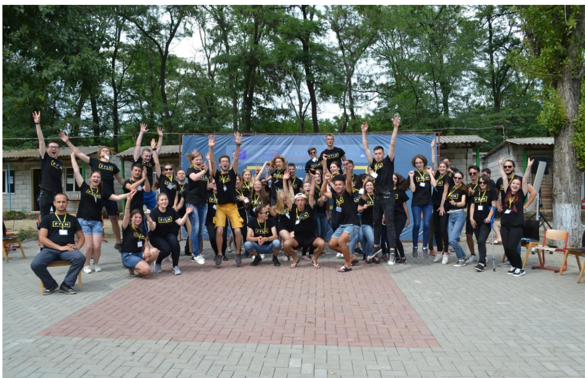
Forum of Young Leaders of Moldova, Komrat – 8. júl 2018