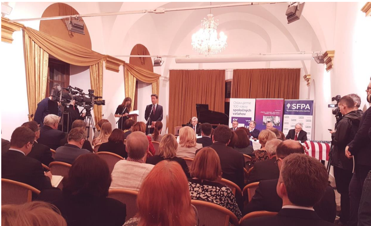
Krst knihy „PRIATEĽ— PARTNER— SPOJENEC: Príbeh slovensko-amerických vzťahov od nežnej revolúcie dodnes“, Bratislava – 5. február 2018