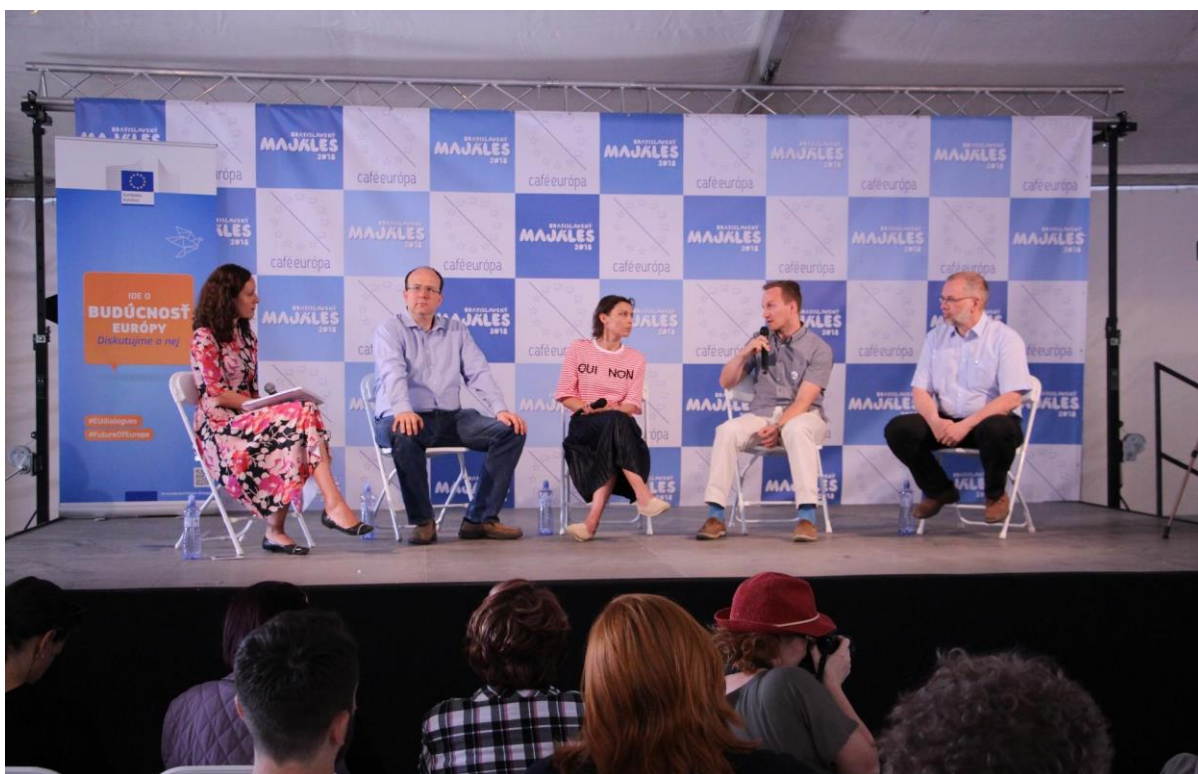
Café Európa: Na Slovensku po bruselsky – Ovládne nás EÚ?, Bratislava – 5. apríl 2018