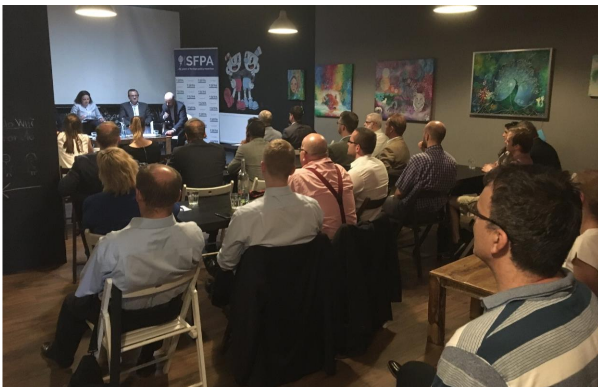
OBSE a kríza na Ukrajine, Bratislava – 13. jún 2018