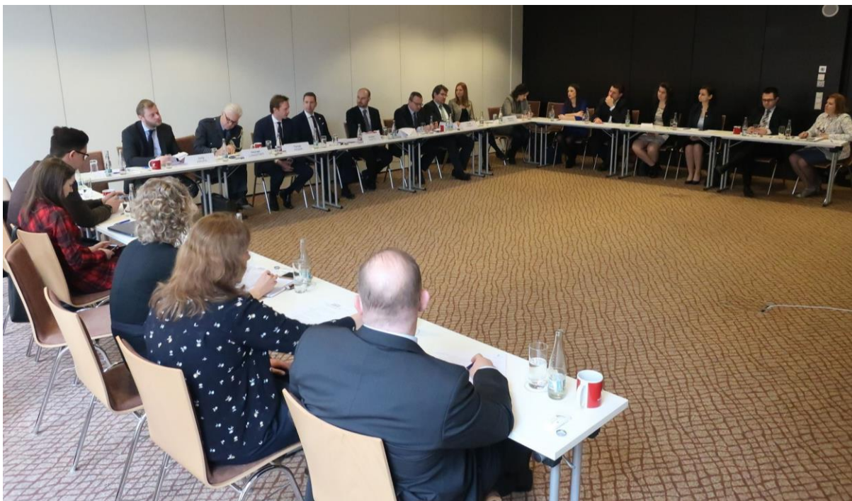
Roundtable with the UK on future relations in foreign and defence policy, Bratislava – 15. marec 2018