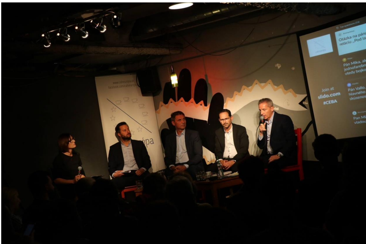
Café Európa: Miesto Bratislavy v EÚ, Bratislava – 23. október 2018