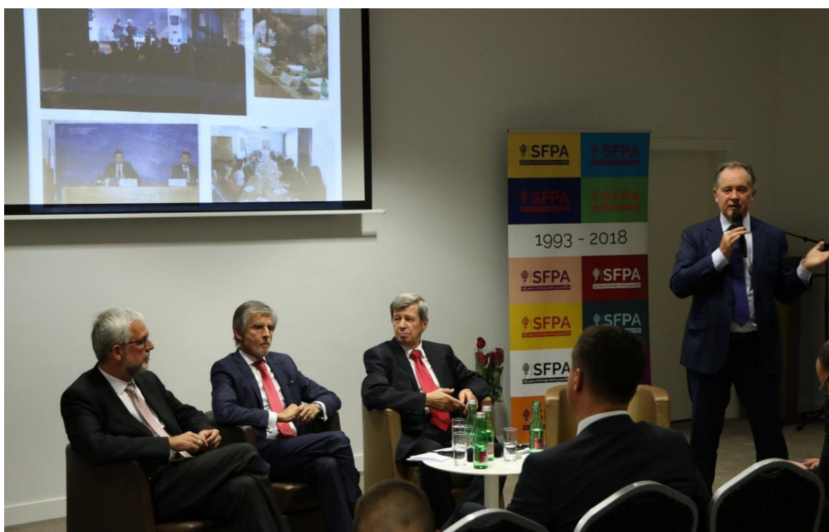
Oslava 25. rokov SFPA, Bratislava – 2. október 2018